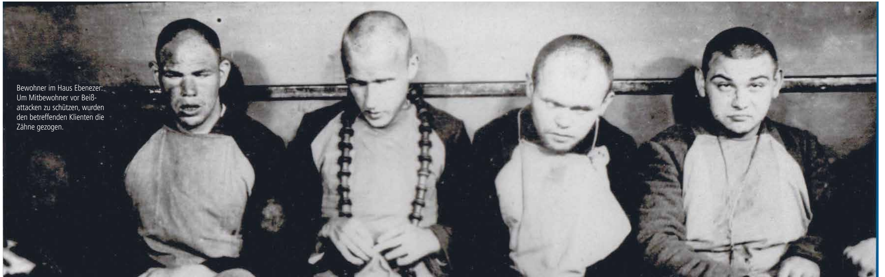
Bewohner im Haus Ebenezer: Um Mitbewohner vor Beiß- attacken zu schützen, wurden den betreffenden Klienten die Zähne gezogen.

Um aggressives Verhalten bei den Klienten zu vermeiden, hielt man es für wichtig, „individualisieren zu können,“ 4 das heißt, die Klienten in kleinen Gruppen unterzubringen. Wichtig war auch eine geeignete Beschäftigung, da Bodelschwingh der Meinung war, „daß für viele Beschäftigungslosigkeit das Gemüt aufs Äußerste gedrückt hat“ 5 und diese Unzufriedenheit wiederum aggressives Verhalten förderte. Deshalb gründete Bodelschwingh viele Handwerksbetriebe, um die Bewohner zu beschäftigen. Auch als klar wurde, dass sich Bethel immer mehr zu einem Lebensraum entwickeln würde, in dem die Klienten dauerhaft leben würden, behielt man die Unterbringung in nach damaligen Verhältnissen kleinen Einheiten bei. Die Häuser, die entstanden, hatten zwischen 20 bis 30 Plätze. Die