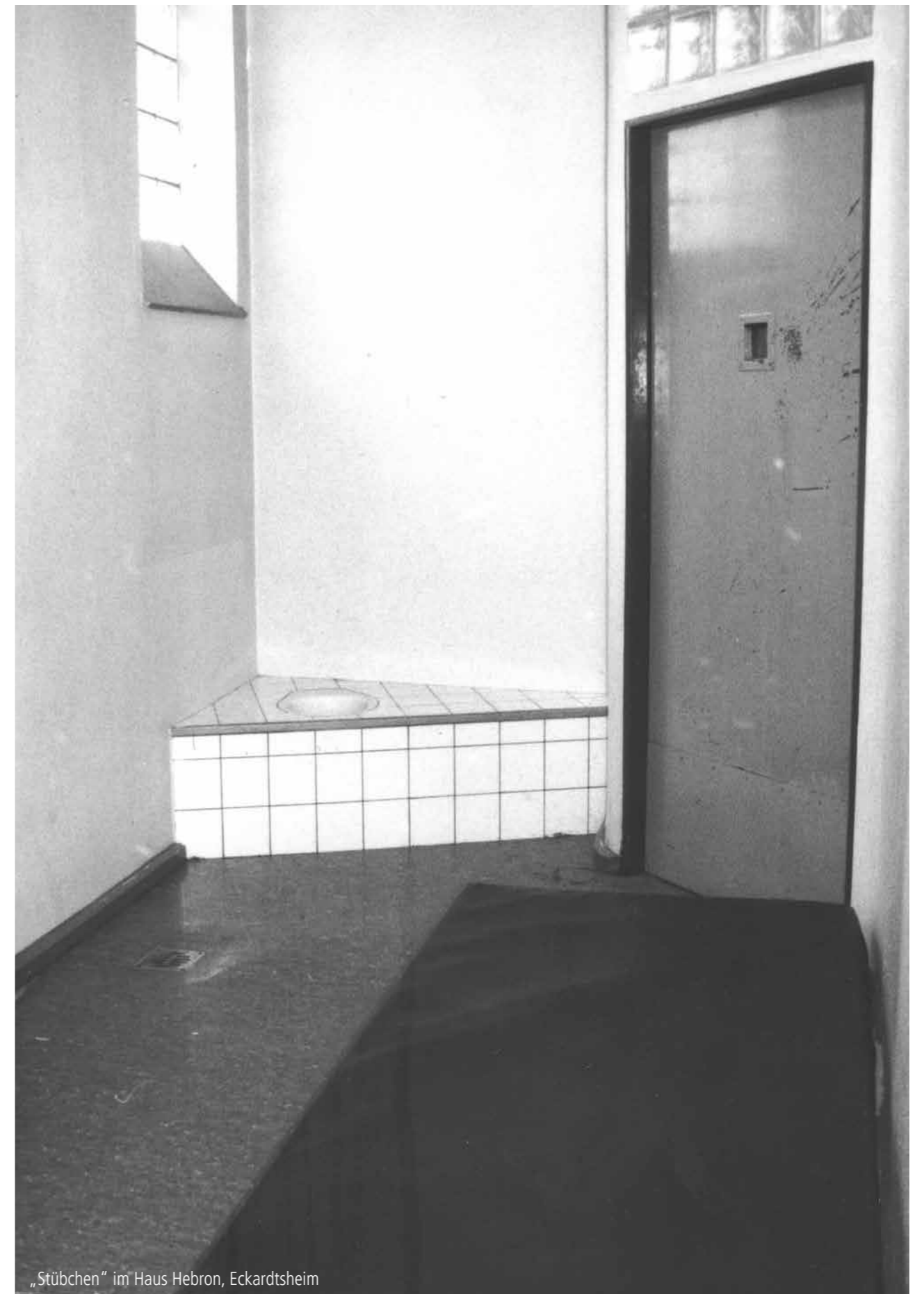
„Stübchen“ im Haus Hebron, Eckardtsheim

werden und die Kranken diese Mißhandlungen entgelten zu lassen.“ 3 Dafür war für ihn ein „großes Maß an Herzenstille, christlicher Reife und geistiger Wachsamkeit“ nötig, das heißt, durch „eine Ausrüstung, die allein der Geist Gottes geben kann.“ Deshalb hielt er die in einer christlichen Gemeinschaft lebenden Diakonissen und Diakonen für das geeignete Pflegepersonal, da die Gemeinschaft die Probleme aufarbeiten konnte. Die Leitungen der Häuser hatten ebenfalls die Aufgabe, das Pflegepersonal zu stärken, indem sie sich wie Eltern um ihre Kinder um das Pflegepersonal kümmern sollten. Dieses wiederum hatte ihren Vorgesetzten zu gehorchen wie Söhne und Töchter den eigenen Eltern. Ein System, das in späteren Jahren Neuerungen und Verbesserungen erschwerte. So berichtete ein Diakon über einen Arbeitseinsatz in den 1960er Jahren, dass ein Vorgesetzter Diakon angeordnet hatte, einmal die Woche die Besenstiele zu schrubben. Kritik der jüngeren Mitarbeiter, diese hätten lieber mit den Bewohnern gearbeitet, wurde mit dem Argument, dies sei ein diakonischer Dienst an einem Mitbruder abgewehrt.