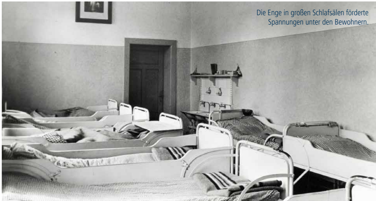
Die Enge in großen Schlafsälen förderte Spannungen unter den Bewohnern.

Die Arbeit brachte auch für die Mitarbeiter große Herausforderungen, wurden sie doch teils unvorbereitet auf den Stationen eingesetzt. Ein angehender Diakon berichtete, dass er eines Tages unverhofft von einem Bewohner geschlagen wurde und er im Reflex zurückgeschlagen hätte, mit der Folge: „Der Patient hat mich nie wieder angefasst.“